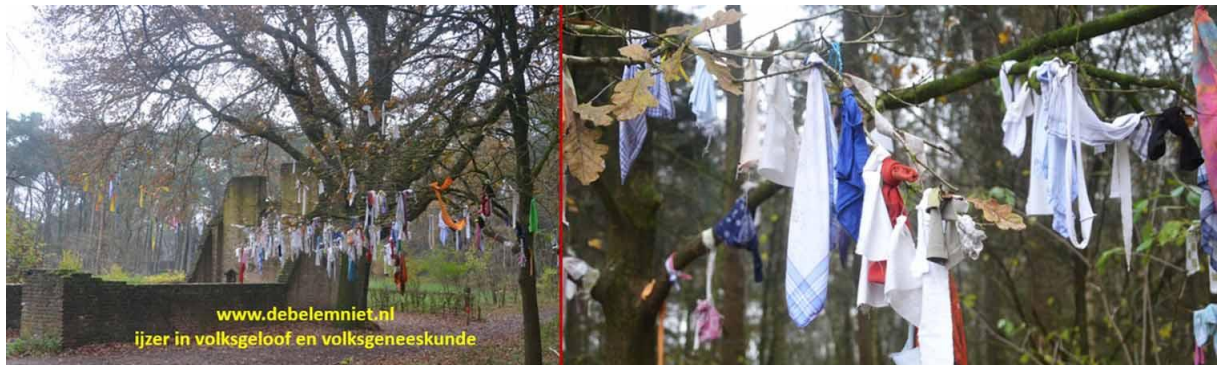
De lapjesboom van Overasselt bij de ruïne van de Sint Walrickkapel. (Opname foto's: 2013)

Naast de eik die als lapjesboom dienst doet, worden ook andere bomen ernaast voor dit doel gebruikt. Mensen hangen stukjes textiel, zakdoeken, linten en zelfs theedoeken in de boom. Volgens het verhaal gaat het hier om koorts afbinden: de boom neemt de koorts over van degene die het betreffende stuk textiel 's nachts op zijn lichaam gedragen heeft. Het lapje moet dan voor dag en dauw in de boom gehangen worden. Maar als we teksten op stukken stof in de boom lezen, wordt duidelijk dat men er ook voor andere gezondheidsproblemen heil zoekt.