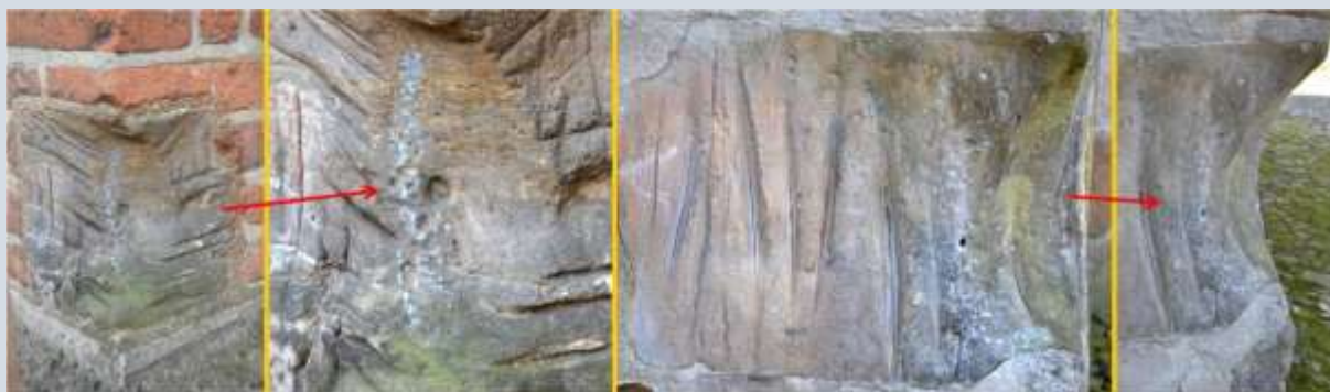
Uitgeholde hoekstenen behoren ook tot de krabsporen

Nog een nieuw ontdekt fenomeen zijn de uitgeholde hoekstenen bij kerkmuren. We troffen ze aan samen met andere krabsporen zoals groeven.