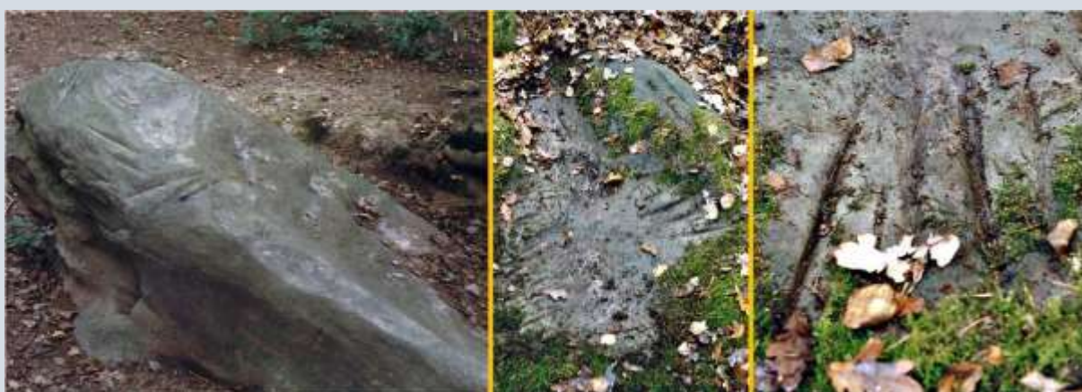
Een op krabsporen lijkend verschijnsel: slijpgleuven op zogenaamde polissoirs waar tijdens het Neolithicum stenen bijlen werden geslepen. Links is de polissoir van Slenaken te zien. In het midden en rechts de polissoir van Zonhoven in België.

4) Inslagkraters van kogels en andere projectielen worden vaak voor napjes aangezien. Dergelijke inslagkraters komen nogal eens voor bij gebouwen die tijdens de Tweede Wereldoorlog of andere oorlogen aan beschietingen onderhevig waren. Inslagkraters zijn hol en hebben verbrokkelde randen. Vaak is het oppervlak der holte oneffen. Echte napjes hebben een effen oppervlak en egale randen.