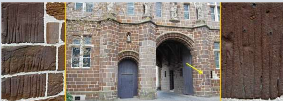
Krabsporen in ijzerzandsteen in Averbode in België

Van stukjes steen is het een kleine stap naar steenstof dat men verkreeg door het van stenen bijlen af te schaven. Dit steenstof van stenen bijlen werd met water vermengd en aan het vee te drinken gegeven om het weer gezond te maken. Bij mensen werd dit steenstof gebruikt tegen vallende ziekte (epilepsie), steken in de zij, allerlei kwaaltjes aan de hals en weeën. Sommige van deze gebruiken bestonden in ieder geval vorige eeuw nog. Soms komt men in archeologische verzamelingen wel stenen bijlen tegen waarin dellen (kuiltjes) zitten. Over de precieze betekenis daarvan bestaat nog geen duidelijkheid maar bepaalde bronnen gaan ervan uit dat deze dellen in feite gewoon napjes zijn, ontstaan door het winnen van steenstof. En die mogelijkheid vinden we niet eens zo gek klinken.