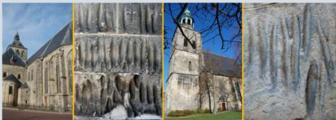
Krabsporen in Bentheimer zandsteen in Oldenzaal (foto 1+2) en in Nordhorn (foto 3+4), Duitsland

In het Niederrheinisches Museum für Volkskunde und Kulturgeschichte in Kevelaer in Duitsland is een doos te zien waarin een gemummificeerde menselijke hand en voet liggen. Volgens de begeleidende tekst was het aan het begin van de 20e eeuw nog steeds een algemeen gebruik om gemummificeerde delen van mensen uit Afrika naar Europa te exporteren. In Europa werden deze delen tot poeder vormalen en daarna vermengd met medicinale kruiden. Mensen gebruikten het aldus vervaardigde geneesmiddel onder andere tegen vergiftigingen. Analyse van de gemummificeerde lichaamsdelen heeft uitgewezen dat ze waarschijnlijk toebehoren aan een 20 tot 40 jaar oude vrouw.