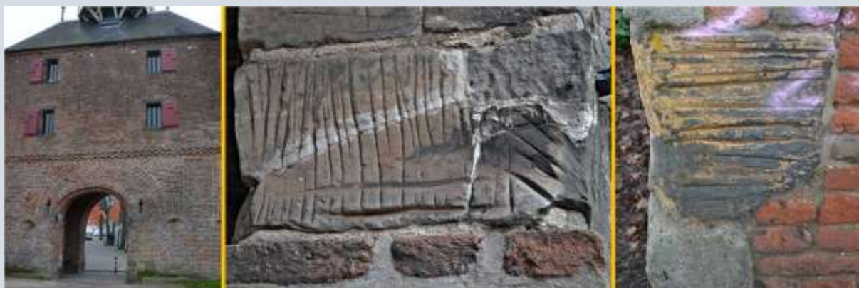
Krabsporen in (stads)poorten in Harderwijk (foto 1+2) en in Zutphen (foto 3)

In de Belgische plaats Vorst in de provincie Antwerpen wisten de mensen de heilige Gertrudis ook te waarderen. Ze riepen haar niet alleen aan als ze last hadden van ratten en muizen maar eveneens om wonden aan de neus en de lippen te genezen en om van eczeem en huiduitslag af te komen. Verder dachten ze dat Sint Gertrudis hen kon helpen bij geestesziekten en als de duivel hen probeerde te verleiden. Als ze door de pest of andere epidemische ziekten geteisterd werden dan hoopte men eveneens dat de heilige Gertrudis hen te hulp zou komen. Van het kerkhof namen pelgrims wat aarde mee die ze thuis dan als remedie tegen van alles en nog wat gebruikten. Het meenemen van wat zand of aarde van kerkhoven of de omgeving daarvan bij kerken waar Sint Gertrudis werd aanbeden, lijkt helemaal niet zo ongebruikelijk. Van dit gebruik tot het krabben van zand van kerkmuren is maar een kleine stap.