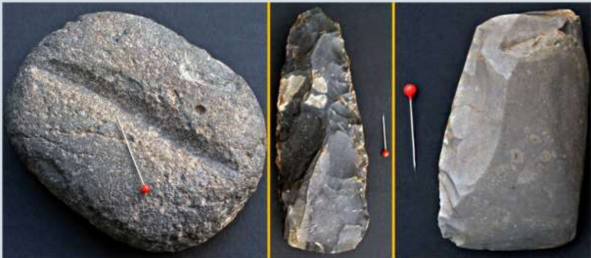
Deze handslijpsteen uit Noord-Afrika voor het schaven van pijlschachten is ook een op krabsporen lijkend verschijnsel (foto 1). Halffabrikaat bijlen zoals op foto 2 werden op polissoirs geslepen. In geslepen toestand zagen ze eruit zoals het exemplaar op foto 3. De speld (3 cm lang) is ter aanduiding van de grootte.