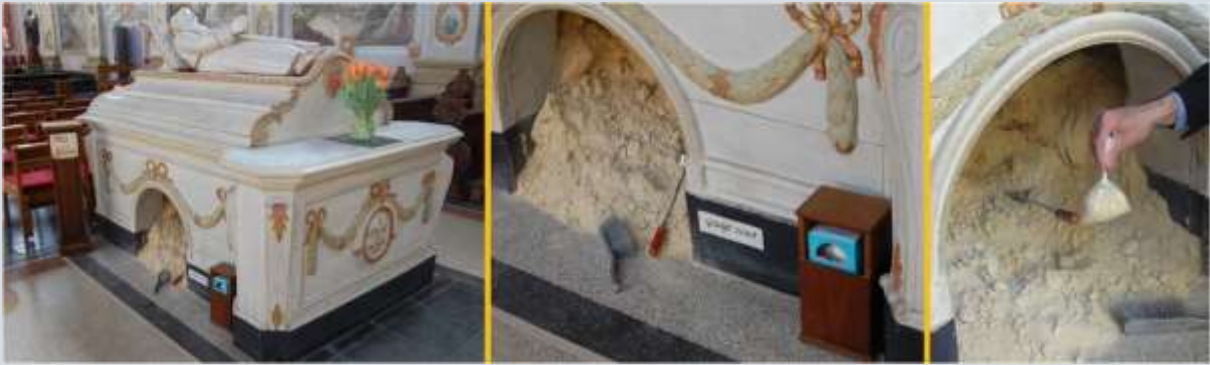
Gewijd zand (mergel) in Sint Gerlach.