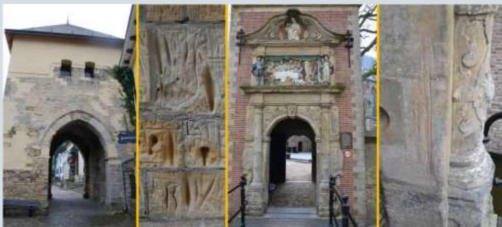
Krabsporen bij (stads)poorten in Valkenburg aan de Geul (foto 1+2) en Gouda (foto 3+4)

Een andere praktijk die tegenwoordig hier en daar nog wordt gebezigd en waarvan we zelf voorbeelden kennen, is het overdragen van wratten op bijvoorbeeld een ui of een stukje spek. Hierbij wordt met de doorgesneden ui of het spek over de wrat gewreven en wordt een kort gebed uitgesproken. Daarna worden ui of spek in de grond gestopt. Als ze vergaan zijn, moet de wrat verdwenen zijn. Als dergelijke gebruiken met de napjes en gleuven samenhangen, hoeven ze het winnen van steenstof natuurlijk niet uit te sluiten.