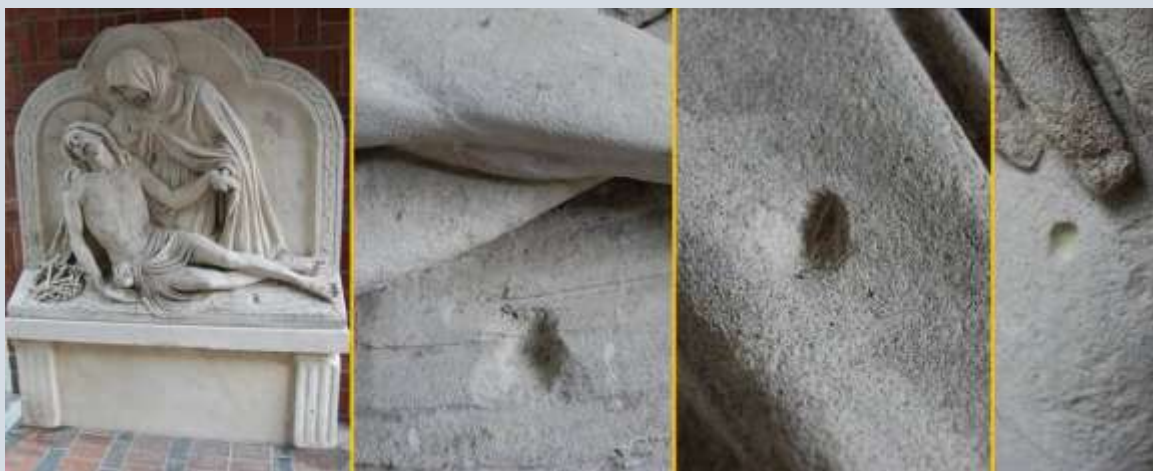
Napjes in de Mater Dolorosa in Kevelaer (Duitsland)

Pelgrims en andere gelovigen was men op het gebied van steenstof ook ter wille door ze in diverse bedevaartsoorden kleine kopieën van vooral Mariabeeldjes (madonnabeeldjes) aan te bieden. De gelovige kon dan naar behoefte steeds wat van het beeldje afkrabben om dan het stof voor zijn heilzame werking aan te wenden. Dergelijke beeldjes kennen we vooral onder hun Duitse naam Schabmadonnen (enkelvoud: Schabmadonna). Bekend zijn de Schabmadonnen van Einsiedeln en Altötting in Duitsland.