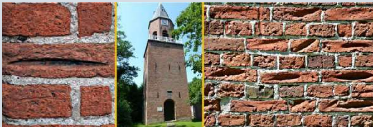
Krabsporen in baksteen in Wijk bij Duurstede (foto 1) en in Bellingwolde (foto 2+3)

Het gebruik van de in ons experiment genoemde lepels vindt Zott niet waarschijnlijk. In zijn boek 'Dämonen, Hexen, Böser Blick' schrijft de Zwitser Kurt Lussi echter over rituele gebruiken met lepels. Zo wijst hij op het onderzoek van de volkskundige Josef Zihlmann waarin sprake is van tot in de 20e eeuw offeren van lepels in een kapel in de omgeving van Luzern (Zwitserland) om van kiespijn verlost te raken. Lussi noemt ook het offeren van bestek in het Zwarte Woud in Duitsland door pas getrouwde stellen om de zegen voor een kinderrijk gezin af te roepen. Het (rituele) gebruik van de lepel om steenpoeder te winnen voor bepaalde geneeskrachtige doeleinden blijven we dus zeker een reële mogelijkheid vinden. Het eerder in dit werk genoemde gebruik van de lepel door de Roemeense boer ondersteunt dit idee. Uitsluitel over het gebruik van bepaalde voorwerpen voor het schrapen en winnen van steenpoeder hebben we echter nergens. Het gegeven, dat er voldoende ijzeren werktuigen onder brede lagen van de bevolking voorhanden zijn, zoals Zott schrijft, zou in ieder geval wel aannemelijk maken, dat krabsporen vaak massaal en op vele plaatsen voorkomen.