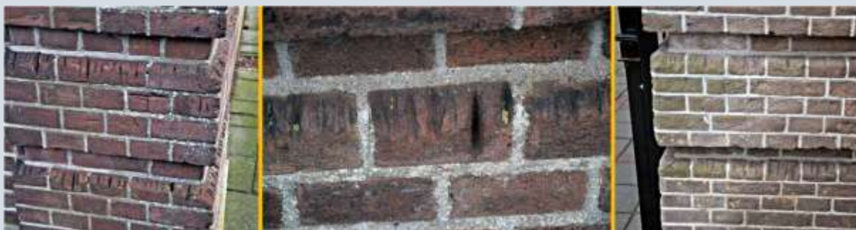
Een op krabsporen lijkend verschijnsel: slijpgleuven ontstaan door het slijpen van griffels

Nederlands Hervormde Kerk van Hekendorp in de provincie Zuid-Holland. Achter deze kerk stond tot in 1985 de dorpsschool. Deze slijpgleuven van griffels zien er heel anders uit dan de groeven die wij tot de krabsporen rekenen. Ze hebben ongeveer de breedte van een griffel en zijn relatief diep met vrij steile 'wanden'. Ze bevinden zich vooral op uitstekende baksteenranden.