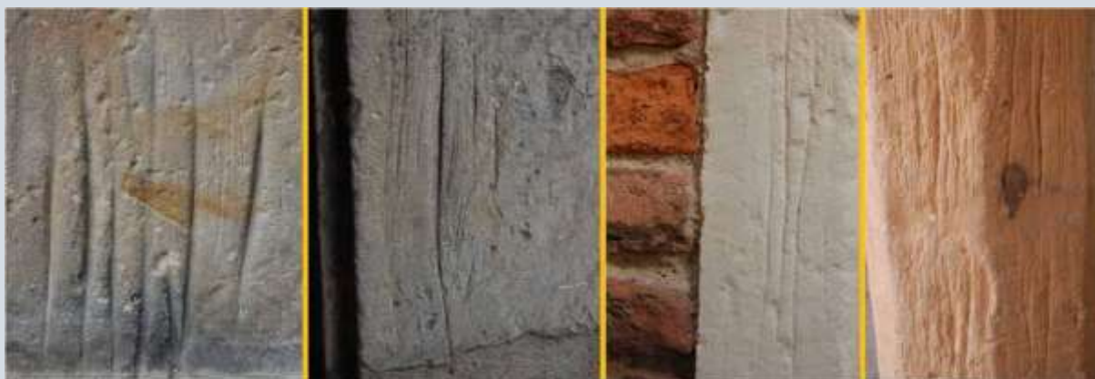
Krabsporen komen ook voor als lange, smalle en ondiepe groeven.

Uithollingen in gesteenten die door verwerking worden veroorzaakt, zien er geheel anders uit. De krabsporen waar we het in dit verhaal over hebben, kunnen uitsluitend door de mens gemaakt zijn.