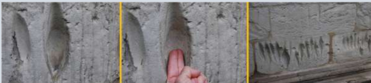
Bootvormige groeven kunnen heel diep zijn.