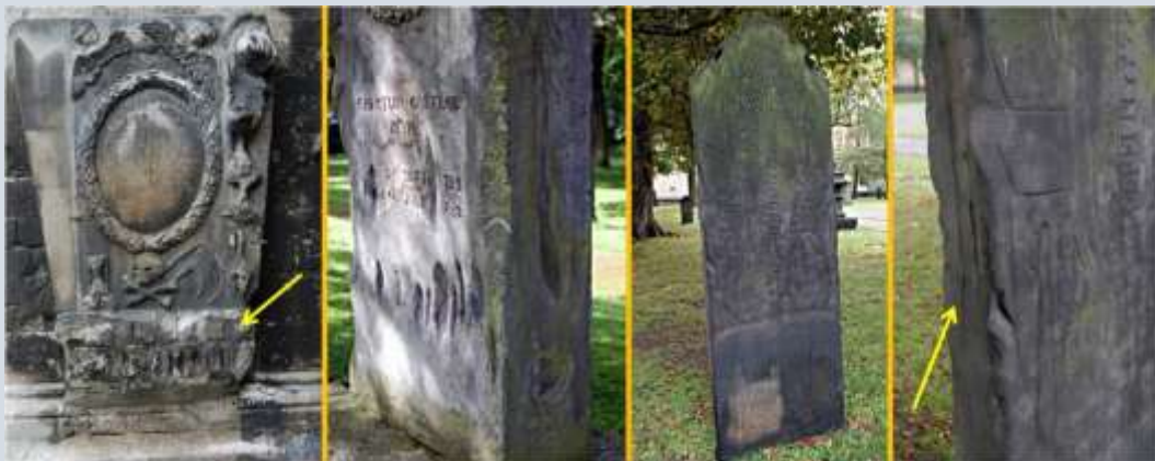
Krabsporen op grafstenen in Halberstadt (foto 1), Göttingen (foto 2+3) en Hannover (foto 4), alle in Duitsland.

Weer andere auteurs geven voor het ontstaan van de krabsporen een verklaring die moeilijk weerlegd kan worden, zeker als je er wat nader onderzoek naar doet. De groeven en napjes zijn ontstaan door het schrapen van steenpoeder. Met dit poeder kon het leven draaglijker gemaakt worden, bijvoorbeeld door het als geneeskrachtig poeder te gebruiken. De mens gebruikte het steenpoeder om besmettelijke ziekten zoals de pest en tyfus mee af te weren en om van deze ziektes te genezen. En in Egypte wordt door gidsen bij de oude tempelcomplexen verteld dat de bootvormige gleuven daar het gevolg zijn van vrouwen die steenpoeder hebben afgekrabd. Dat poeder vermengden ze dan met voedsel waarna ze het opaten om vruchtbaarder te worden. Steenpoeder dat op deze manier van kerkmuren en andere religieuze gebouwen was gewonnen, was een heilig poeder. In het volksgeloof was het een echt medicijn. Maar hebben we bewijs hiervoor? In het volgende zullen we deze verklaring nader bekijken.