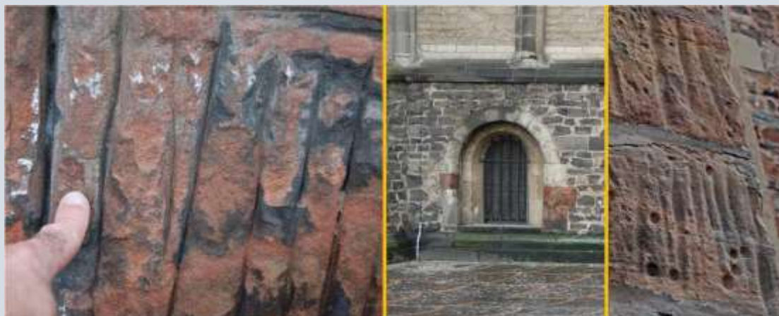
Krabsporen in bontzandsteen in Bonn (foto 1+2) en in Saarburg (foto 3), beide in Duitsland

Geïnspireerd door het verhaal van Minst, vermeldt Werner Haas in 1976 het volgende bijzondere verhaal: In Birkheim über Kastelaun in Duitsland bevond zich een altaar waarvan gezegd werd dat het steenstof ervan het vee erg goed zou doen. Het zou er snel van groeien. Dat bracht boeren die ernaar op bedevaart gingen op het idee om steenstof van dat altaar af te schaven en dat bij het vee in het voer te doen. Het ging er steeds meer op lijken dat het altaar compleet in veevoeder zou veranderen. Toen aan de boeren bekend gemaakt werd dat het altaar uit gips bestond en dat elk ander gips ook voor dit doel geschikt was, namen ze dat aan en werd het altaar niet meer verder afgeschaafd. Haas had dit interessante verhaal in een publicatie uit 1793 gevonden.