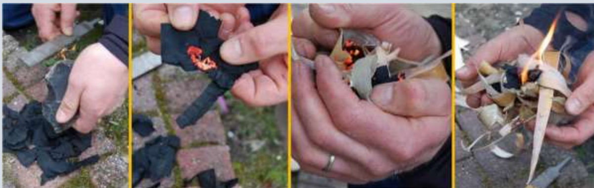
Vuur maken met een vijl, een stuk vuursteen en verkoold linnen. Let op de overspringende vonk bij de linker foto.

Het slaan van dit vuur op de muren van de kerk zou aldus de groeven veroorzaakt hebben. Laten we hier eens beter naar kijken. Om vuur te slaan, gebruikte de mens in het verleden een stuk vuursteen en een stuk koolstofhoudend ijzer (de zogenaamde vuurslag). Daarnaast hadden ze tondel nodig. Tondel is een goed brandbaar materiaal dat van bijvoorbeeld een tondelzwam of verkoold stof gemaakt kon worden. Met de vuurslag schraapte men langs de vuursteen. Daarbij ontstond uit loslatende minuscule ijzerdeeltjes de vonk die dan in de tondel werd opgevangen. Door blazen kon de tondel verder aan het gloeien gebracht worden. Door het toevoegen van brandstof, bijvoorbeeld fijn houtschaafsel, kon dan een vuurtje gebouwd worden. Vaak zaten de hiervoor genoemde ingrediënten om vuur te maken in een tondeldoos die we zouden kunnen zien als de voorloper van de lucifer. Tondeldozen raakten aan het begin van de twintigste eeuw in onbruik.