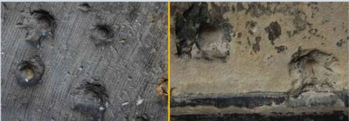
Inslagkraters van kogels

Kogels en andere projectielen kunnen (kleine) kraters in muren veroorzaken. Bij oudere gebouwen komen zulke kraters regelmatig en soms in grote aantallen voor. Deze kraters stammen uit de Tweede Wereldoorlog maar ook van eerdere oorlogen. Deze kraters zijn hol en hebben verbrokkelde randen. Vaak is het oppervlak van de holte oneffen. Napjes hebben echter een effen oppervlak en egale randen. Ze zien heel anders uit dan de kraters van projectielen.