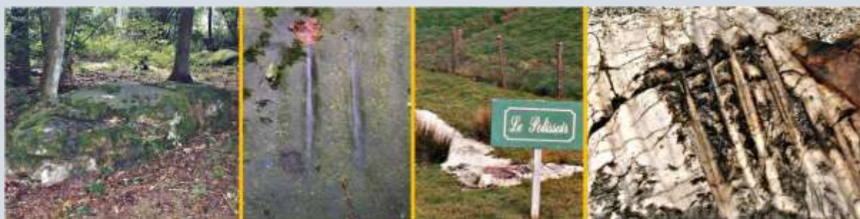
Polissoirs van Velaine-sur-Sambre in België (foto 1+2) en Saint -Benoît in Frankrijk (foto 3+4)