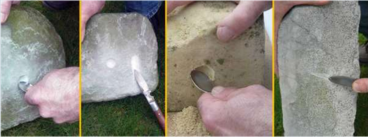
Experimenteren met het maken van krabsporen in Bentheimer zandsteen (foto 1+2), in kalksteen ('mergel', foto 3) en in kolenkalksteen (foto 4)