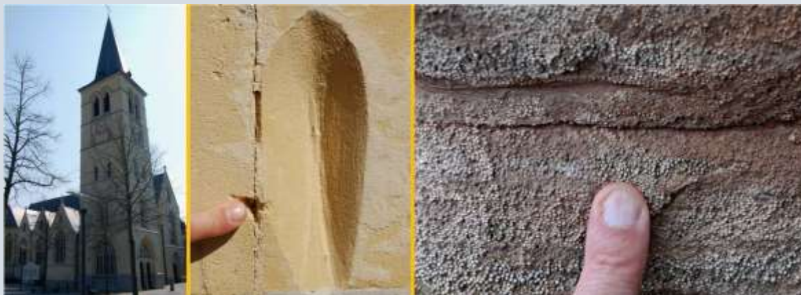
Krabsporen in kalksteen ('mergel') in Bree in België (foto 1+2) en in Rogenstein in Braunschweig in Duitsland (foto 3)