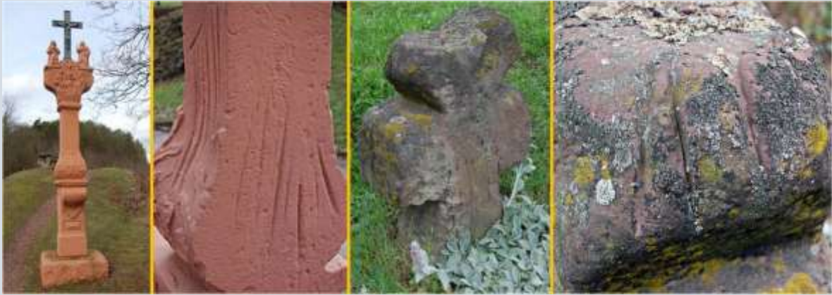
Krabsporen op wegkruisen bij Reiler Hals langs de Moezel (foto 1+2) en in Allstedt (foto 3+4), beide in Duitsland.