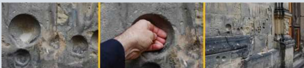
Napjes zijn er in allerlei formaten. Sommige zijn groot genoeg om een hand in te stoppen.

De Sint Nicolaaskerk van Denekamp is ook van Bentheimer zandsteen gebouwd. Toen we de kerk bekeken, ontdekten we aan een van de buitenwanden een aantal diepe verticale groeven (gleuven) met de vorm van een boot. Deze groeven liepen parallel. Later die dag waren we in Oldenzaal, eveneens in Twente. Daar is de Plechelmuskerk ook van Bentheimer zandsteen gebouwd. Hier troffen we de zelfde vreemde groeven in grote aantallen aan.