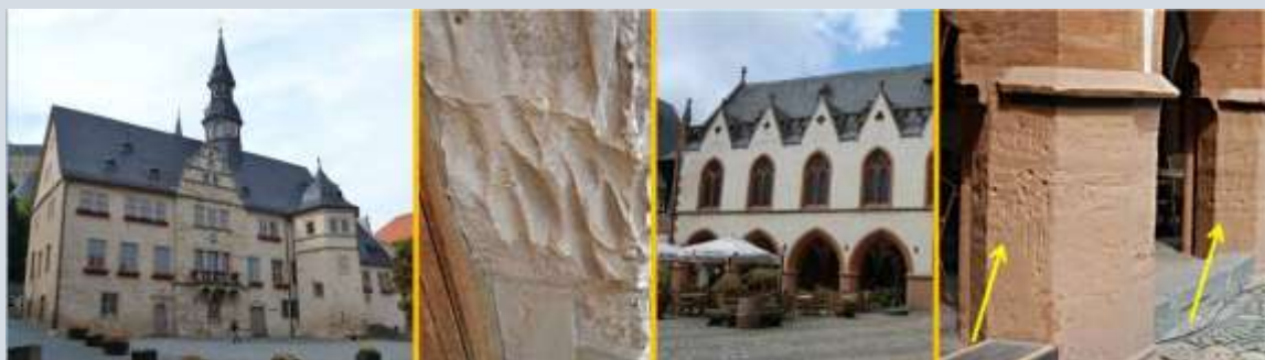
Krabsporen in de stadhuizen van Blankenburg (foto 1+2) en Goslar (foto 3+4), beide in Duitsland

mogen rekenen. Gelovigen komen in de kapel tot Saint Mort bidden om van bijvoorbeeld hoofdpijn en kiespijn af te komen. Mogelijk wordt de aarde onder het altaar niet alleen meegenomen om aan de dieren te geven maar gebruiken mensen ze ook voor zichzelf. In de kuil met aarde zien we immers ook spenen van kleine kinderen liggen, die als ex voto's zijn achtergelaten. Dat gebeurt wel meer in kapellen en kerken.