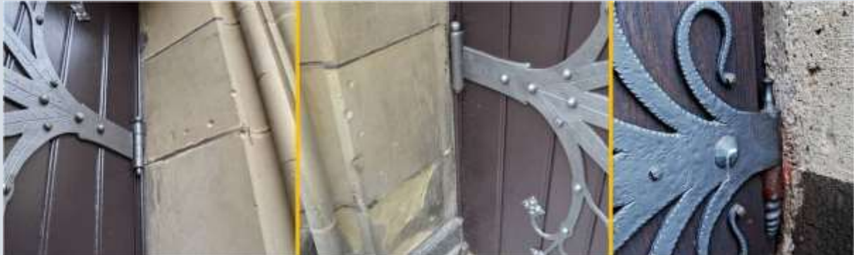
Een op krabsporen lijkend verschijnsel: pseudonapjes die zijn ontstaan door de ronde koppen van bouten waarmee de scharnieren van deuren zijn bevestigd.

Op behoorlijk wat plaatsen troffen we krabsporen aan die waren opgevuld met cement. Opvallend daarbij is dat vrijwel altijd maar een deel van de krabsporen is dichtgesmeerd. De rest is nog gewoon 'open'. Waarom zouden maar enkele ervan dichtgesmeerd zijn? Op deze vraag hebben we nog geen antwoord. Dat hebben we ook niet op de vraag wie de krabsporen dichtsmeerde. We kunnen ons voorstellen dat de eigenaren van de betreffende gebouwen niet gelukkig waren en zijn met het krabben van steenpoeder uit de muren. Wij zien de krabsporen als historisch erfgoed maar goed beschouwd was het maken ervan ook een verfijnd en beperkt soort slopen van het betreffende gebouw. Mogelijk probeerden de eigenaar verder krabben tegen te gaan door de bestaande krabsporen dicht te smeren.