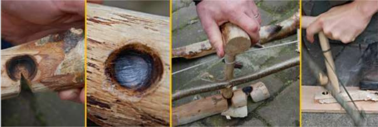
Experimenteel vuur maken met een vuurboog. De twee rechter foto's laten zien hoe de 'boor' in het 'napje' snel heen en weer draait. Geheel rechts is de eerste rook te zien.

We gaan weer terug naar de theorie van de napjes. Bij de napjes zou zowel houtstof als tondel uit het draaigat vallen want de vuurboog met toebehoren wordt horizontaal gehouden en het napje zit in een muur die natuurlijk verticaal is. Dit kan dus gewoon niet. Zo kun je geen vuur maken. En als je dan naar de napjes zelf kijkt, deze zijn meestal mooi bolvormig. Als je met een stok in een muur gaat draaien, krijg je niet zulke vormen.