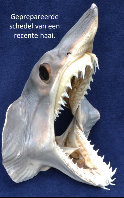
Geprepareerde schedel van een recente haai.