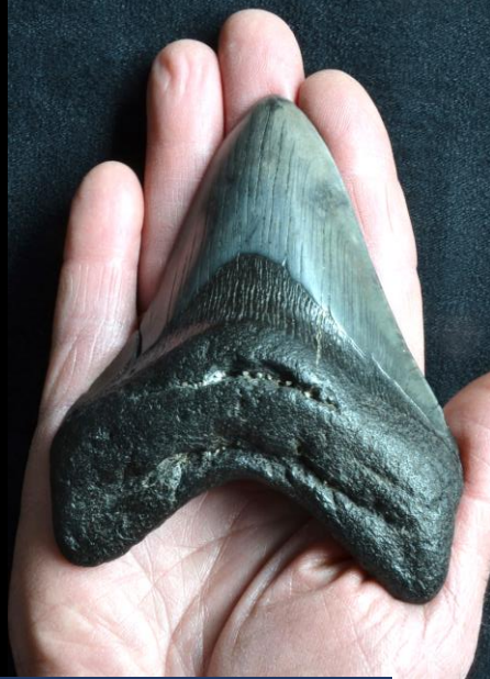
Tanden van Megaelachus megalodon