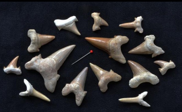
Fossiele haaietanden uit Khouribga in Marokko. Ze zijn soms in mooie kijkdozen te krijgen.

Druk je eigen poster af. Commercieel gebruik niet toegestaan