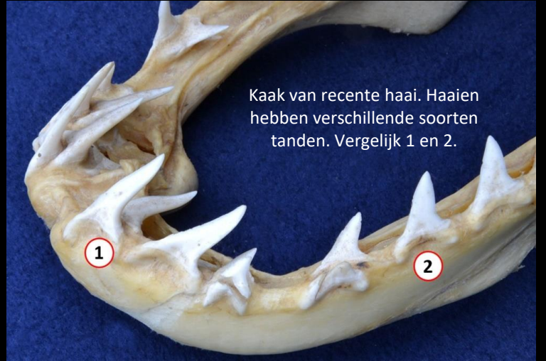
Kaak van recente haai. Haaien hebben verschillende soorten tanden. Vergelijk 1 en 2.