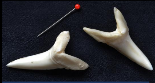
Recente haaietanden zijn in het algemeen wit van kleur.