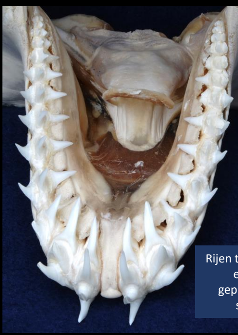
Rijen tanden achter elkaar bij geprepareerde schedel.