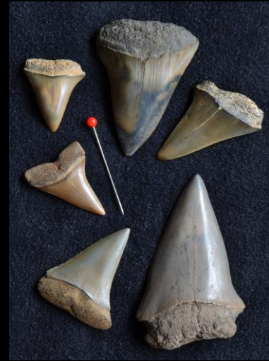
Fossiele haaietanden uit sedimenten bij Antwerpen.