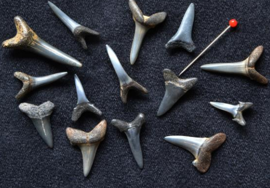
Haaietanden van het strand bij Cadzand