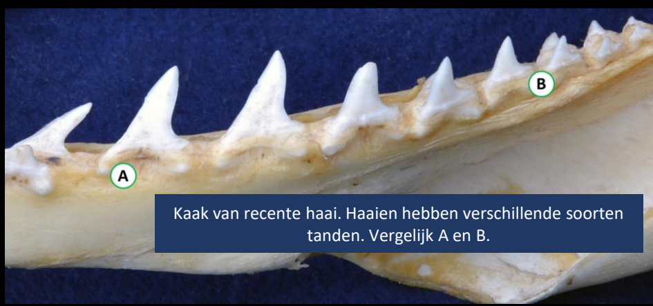
Kaak van recente haai. Haaien hebben verschillende soorten tanden. Vergelijk A en B.