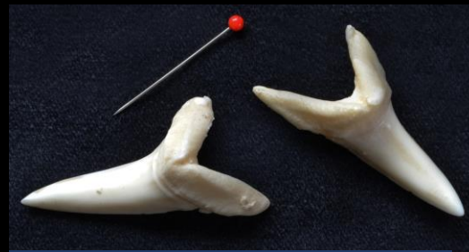
Recente haaietanden zijn in het algemeen wit van kleur.