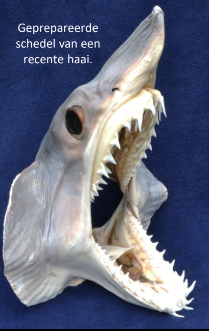
Geprepareerde schedel van een recente haai.