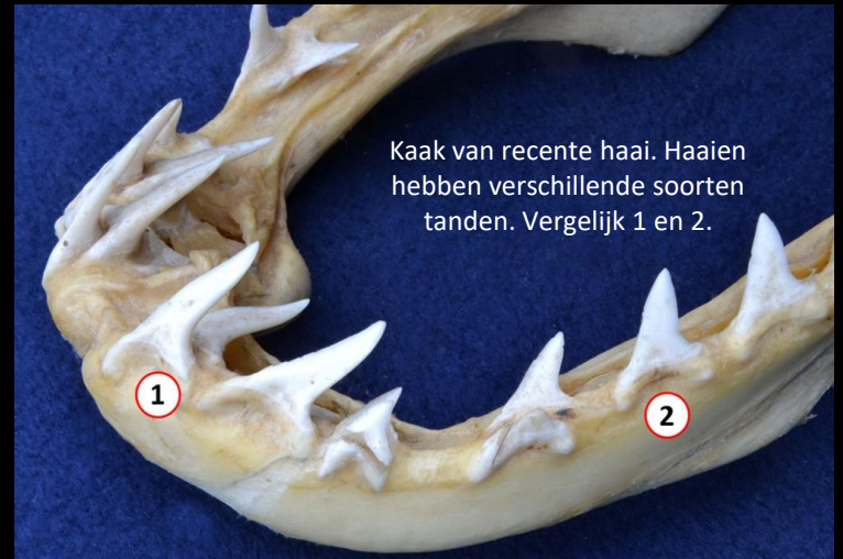
Kaak van recente haai. Haaien hebben verschillende soorten tanden. Vergelijk 1 en 2.